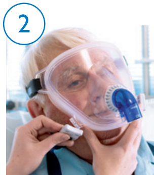
2 Prenda e ajuste o fixador