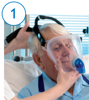
1 Posicione o fixador e a máscara

Ajustar a PerforMax exige três etapas simples, conforme mostrado nas figuras.