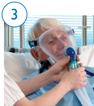
3 Conecte a máscara e o ventilador